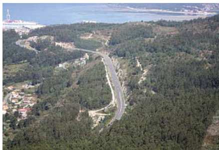
El Monte Pituco se ubica en la zona alta de Marín.

APDR considera que Marín necesita un suelo industrial ya que está dando a los terrenos portuarios ese uso indebidamente, pero reclama la responsabilidad de los políticos a la hora de respetar el patrimonio cultural y natural "que está onde a natureza a a Historia decidiron e eles teñen a responsabilidade de conservar ese patrimonio que é de todos".