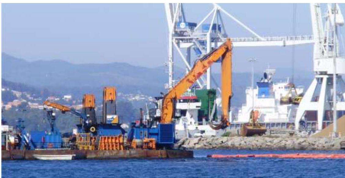
Figura 5. Fotografía da maquinaria utilizada na execución dos recheos no peirao denominado Muelle Leirós o 16 de agosto de 2011.

De todo o argumentado pódese concluír que: