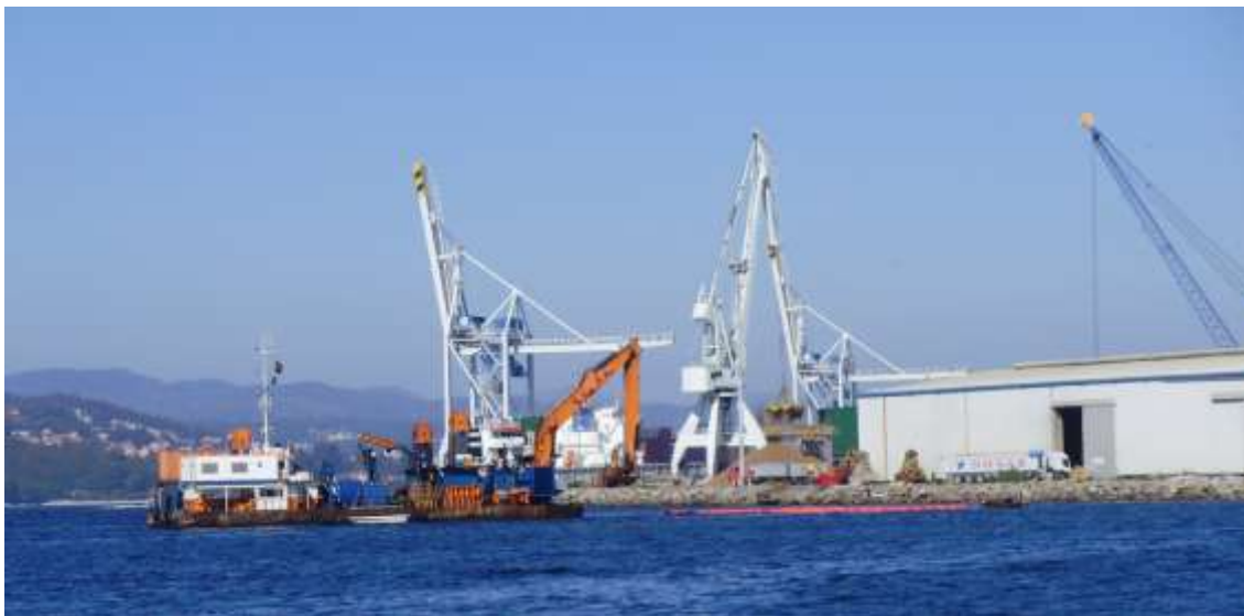
Figura 4. Fotografía das obras de preparación dos recheos no peirao denominado Muelle Leirós o 16 de agosto de 2011.

Na actualidade, tal e como se pode comprobar por medio das fotografías que acompañan este escrito, con absoluto desprezo das decisións xudiciais que ilegalizan os plans especiais e obrigan á retirada dos recheos xa realizados, a Autoridade Portuaria de Marín e Ría de Pontevedra, ven de iniciar a instalación dos recheos comezando pola cimentación dos caixóns de formigón armado (xa construídos) que formarán os frontes dos recheos. As figuras 4 e 5 son fotografías tomadas o 16 de agosto nas que se pode apreciar, no peirao onde se van a realizar os recheos, a maquinaria que está a preparar a zanja para a cimentación.