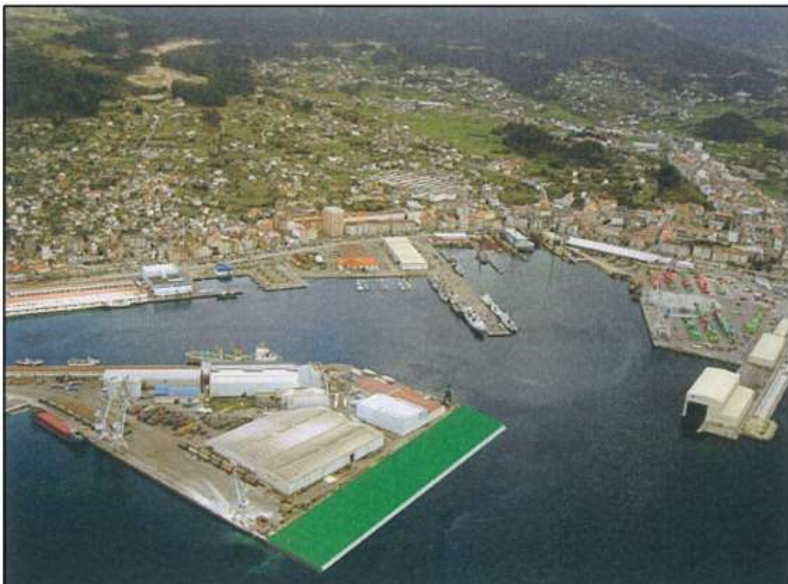
Figura 3. Recreación virtual do resultado dos recheos tal e como aparece no Estudio de Impacto Ambiental do denominado "Proyecto básico de adecuación de infraestructuras del sector comercial del Puerto de Marín".