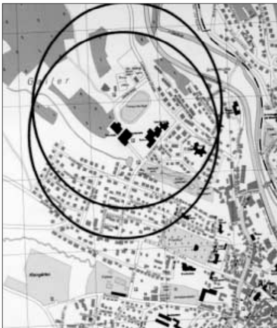
Figura 1: Plano esquemático de la ubicación de las antenas.

Hasta el momento no se ha realizado ninguna vigilancia continuada del estado de salud de la población que vive cerca de estaciones base de telefonía móvil.