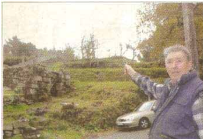
Un vecino señala una de las antenas de Salcedo.

El colectivo de afectados por la instalación de antenas en Salcedo y Vilaboa, con el apoyo de la Asociación pola Defensa da Ría (APDR), entregarán hoy en el concello de Pontevedra las firmas recogidas contra la instalación de estas antenas de telefonía móvil. Esta recogida de firmas se acordó en una asamblea vecinal celebrada el pasado 2 de diciembre.