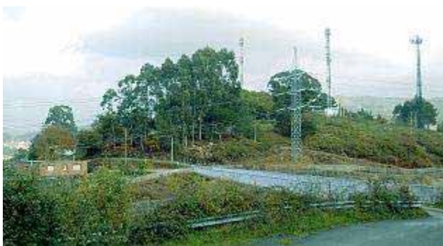
Vista del lugar de A Esculca en donde se encuentran instaladas tres estaciones de telefonía móvil y una torreta de alta tensión .

Pontevedra vive un auténtico drama de salud pública a menos de cinco kilómetros del centro urbano. La parroquia de Salcedo y la vecina de Bértola, en Vilaboa, podrían estar siendo el escenario de la cara oculta de las nuevas tecnologías. La realidad comprobada es que en los lugares de A Esculca, Carballa y Saxosa ya han fallecido dos personas a causa del cáncer y otras ocho son víctimas de esa terrible enfermedad. Los lugareños miran hacia las tres estaciones de telefonía móvil y una gran torreta de alta tensión instaladas en las proximidades de las viviendas, entre 50 y 300 metros.