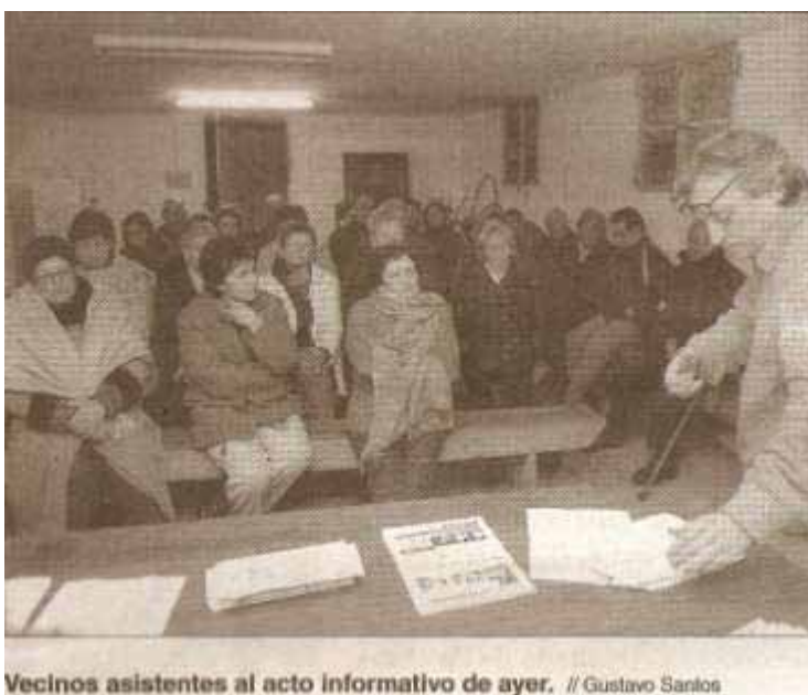
Vecinos asistentes al acto informativo de ayer.