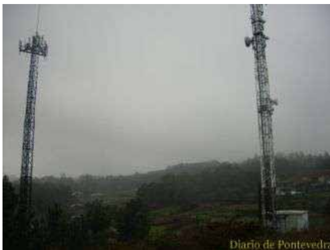
Dos torres está en Salcedo (en la imagen) y la tercera, en Bertola. C.G.B

«Y ADÓNDE VAS?» Entonces, ¿por qué no se mudan? La respuesta es unanime: «Y adónde vas? Con lo difíciles que están las cosas, hay que tener suerte y familia con casa fuera de aquí para poder dejar la vivienda propia e irse a vivir a otro lado», asegura una de las mujeres afectadas por el cáncer. «Además -apunta su hermana-, por aquí no hay pisos, todo el mundo vive en las casas en las que nacieron, o que construyeron ellos mismos. ¿Cómo vas a dejarlo todo?»