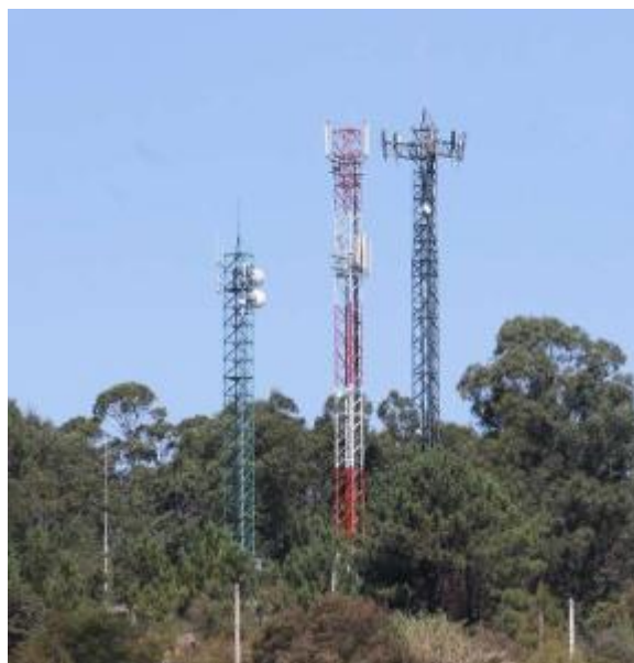
Antenas de telecomunicaciones en Castiñeiras, Bueu.

proyecto de ley de telecomunicaciones sobre el que trabaja el Estado. El colectivo advierte de que ese documento concede a comunidades autónomas y ayuntamientos "un papel subsidiario, coa realización de informes non vinculantes".