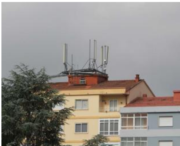
Una antena de telefonía en un edificio del centro urbano de Ourense.